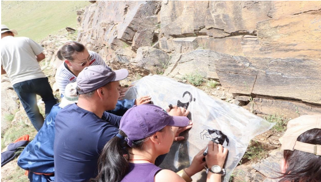
Зураг 1. Хаднаах зурагнаас хуулбар авч буй байдал (Оорцог, Ханан).

Дэлхийн Өв-Орхоны Хөндийн Соёлын Дурсгалт Газрын хамгаалалтын захиргаа, Хархорум музей, Өвөрхангай аймгийн Хужирт сумын ЗДТГ, Соёлын төвтэй хамтран 2019 оны 06-р сарын 12-ноос 06-р сарын 16-ны хооронд Хужирт сумын түүх, соёлын үл хөдлөх дурсгалуудын мониторинг тандан болон хадны зургийн хайгуул судалгаа явуулж, Монгол улсын түүх, соёлын үл хөдлөх дурсгалт зүйлийн бүртгэлийн маягтын дагуу бүртгэн баримтжуулалтыг сайжруулахад арга зүйн зөвлөгөө өгч, хаднаах зураг, бичгийн дурсгалаас хэв хуулбар авч хамтран ажиллаа.