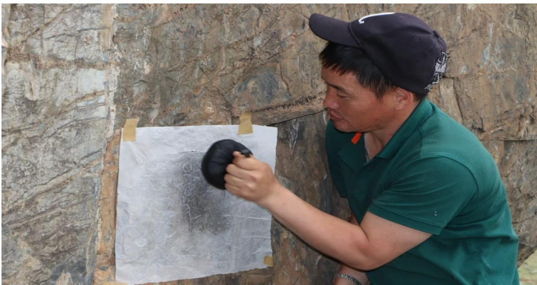
Зураг 2. Хаднаах бичгийн дурсгалаас хэв, хуулбар авч буй байдал (Майхан толгой).