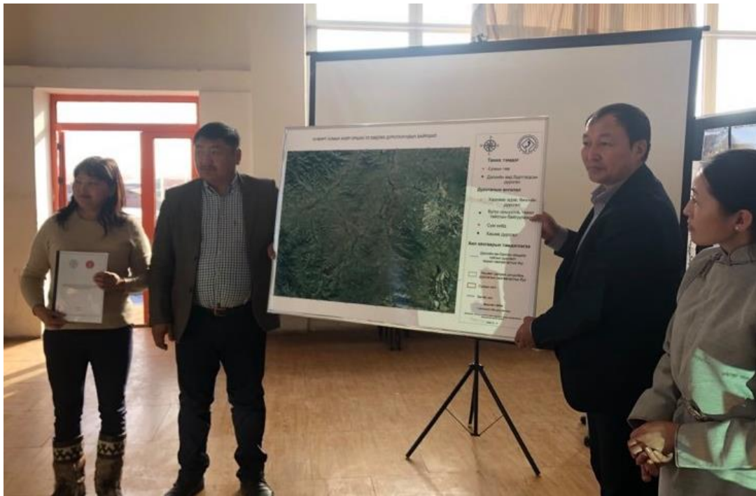
Зураг 1. Хужирт сумын нутаг дахь түүх, соёлын үл хөдлөх дурсгалуудын байршил.

Уг судалгаагаар Хужирт сумын үл хөдлөх дурсгалуудын бүртгэл мэдээллийн сангийн тодорхойлолтыг шинэчлэн боловсруулан, 780 гаруй гэрэл зураг, 130 гаруй минутын дүрс бичлэг, хамрах хүрээ, нягтаршлыг тодорхойлж газарзүйн байршлыг харуулсан зураглал боловсруулан Хужирт сумын ЗДТГ, Соёлын төвд хүлээлгэн өгөв.